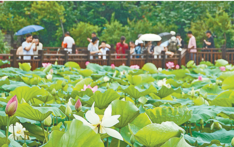
昨日,紫荆山公园,雨中的荷花分外美丽,吸引了众多市民驻足欣赏夏日荷塘美景。

市司法局和政务服务大厅为提升政务服务水平,全省首创在发证现场设置电子喜报背景墙,供2000多名领证人员拍照留念。