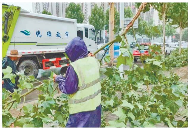
昨日,郑州突降大雨,金水区市政绿化所科学研判,周密部署,提前准备物资材料、工具设备等,出动10个抢险突击队蹲守于辖区各个应急点位。图为绿化人员清理降雨造成的大树断枝。

7月3日下午,郑州市自然资源和规划局、郑州市气象局联合发布汛期地质灾害气象风险预警,7月3日晚到4日,郑州市地质灾害气象风险预警达到黄色预警的地区为:登封西北及东北部、新密周边、荥阳南部、新郑西部,发生地质灾害的可能性较大。具体包括:登封市唐庄镇、颍阳镇、君召乡、大冶镇,新密市袁庄乡、岳村镇、刘寨镇、曲梁镇、大隗镇、苟堂镇、平陌镇、牛店镇,荥阳市崔庙镇、贾峪镇,新郑市辛店镇。