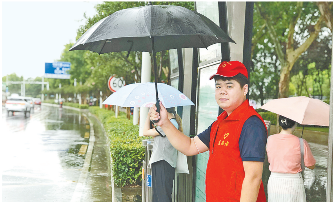
贴心服务助乘客出行

本报讯(记者 张倩 刘玉娟 文/图)昨日,郑州迎来降雨天气。为进一步做好防范应对,郑州公交集团根据雨情迅速行动,第一时间启动防汛应急预案,各岗位人员迅速进入待命状态,科学调配运力,保障乘客出行安全。同时,多支防汛应急救援小分队迅速集结,在各公交场站、重要调度点,发放沙袋、救援绳、救生圈、救生衣等防汛物资。