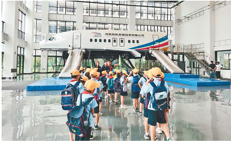
在研学课程中,学生近距离探索飞机的“奥秘”

据了解,航投文旅《航空梦,中国梦》主题的研学课程以梦为主线,分为“点亮”“启航”“寻梦”“逐梦”“筑梦”“起航”六大板块,主要包括航空科普、航空企业参观、航空餐食、航空地勤、航空空勤、翱翔