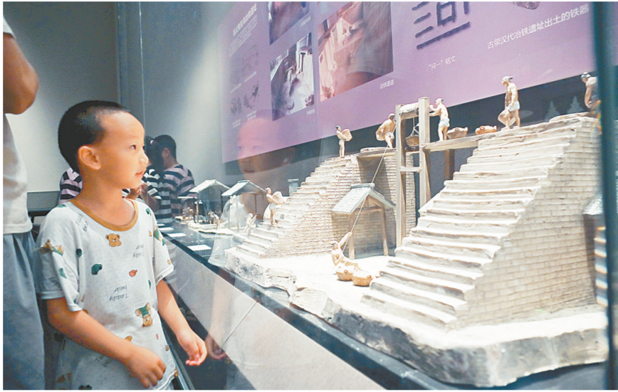
多家博物馆为观众送上“智慧文博大餐”

“近两年,我们馆相继上线《繁星盈天》《千秋德业》等15场线上展览,让市民足不出户即可云上观展。”昨日,据郑州博物馆相关负责人介绍,在构建线上虚拟展览时,技术人员使用3D模型、模型标定等技术完成对博物馆实景展厅的虚拟构建。走进郑州博物馆二层“创世王都”展厅入口,你会被3D全息投影技术呈现的