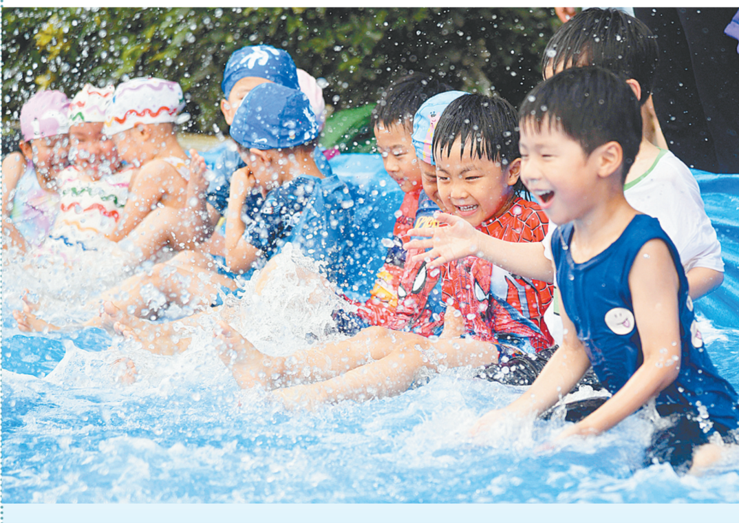
高温来袭,昨日下午,金水区圣菲城幼儿园内,老师、家长和孩子们进行了一场亲水游戏,幼儿园变成了欢乐水世界。