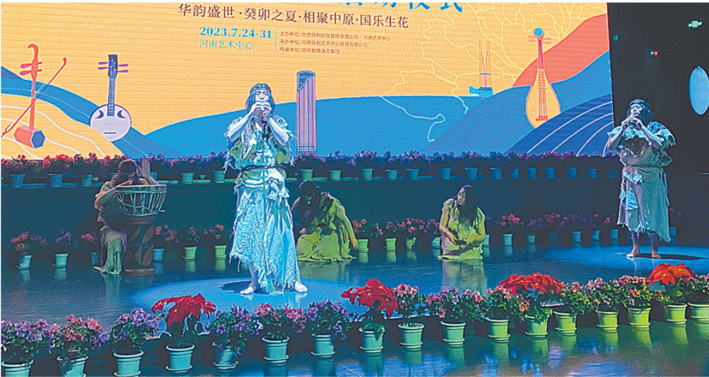
启动仪式上华夏古乐团表演《远古的回响》

本报讯(记者 秦华文)38位国乐名家齐聚郑州,7场民族音乐会奏响绿城……7月24日,全国首届“名师领航”2023保利(河南)国乐艺术节在河南艺术中心正式启幕。在7天的举办时间里,来自全国各地的民乐学子将来到“天地之中”,共赴这场瑰丽的民乐盛事。