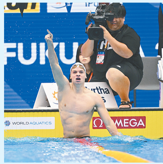
马尔尚在比赛后庆祝夺冠

我现在的目标是要比今年更好。去年4分04秒就是令我吃惊的成绩了,然后我一直努力改正我的问题,现在我进步了,并且游出了个人最好成绩,我会继续加油。