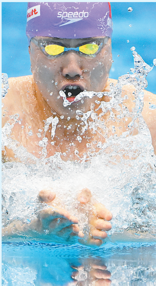
覃海洋在决赛中

56秒12的成绩获得冠军,如愿以偿地摆脱了世锦赛“铜牌专业户”的称号,夺得个人首枚世锦赛金牌。虽然在东京奥运会上拿到200米蝶泳冠军,但张雨霏在世锦赛上一直不太顺利,在2022年布达佩斯世锦赛女子蝶泳从50米到200米三个距离的比赛中全部获得铜牌。