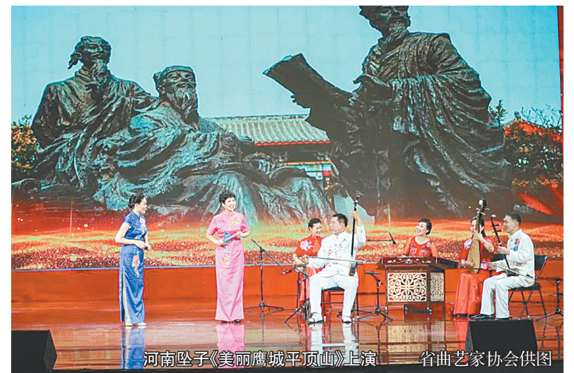
河南坠子《美丽鹰城平顶山》上演

活动期间还举办了惠民演出。8月4日晚,中国曲艺牡丹奖艺术团“送欢笑”惠民演出在平顶山市会议中心举行,国家级知名曲艺表演艺术家登台献艺,河南坠子、相声、大鼓、数来宝、京韵大鼓、谐剧等节目轮番登场,为广大市民带来了一场高质量文化盛宴。