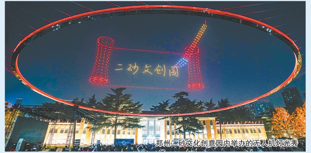
郑州二砂文化创意园内举办的无人机灯光秀

坚持保护和开发并重原则，二砂文创园推进项目建设的同时，更是把文物保护放在首位。对文保建筑进行修缮，有5栋文保建筑立项计划书已通过省市文保部门上报国家文物局，并同步完成文保建筑修缮设计方案公开招标。 据介绍，按照规划及用途，该项目还对部分地块规划进行调整。主要调整出让地块（A-07和D-02）控制部分，目前调整规划方案已上报规划部门，将261亩出让用地与374亩文创园一并纳入城市更新项目实施方案。 二砂文创园积极开展招商工作，并对首开区业态优化。自年初举办二砂项目集中签约仪式以来，按照园区产业定位，洽谈考察优质企业，积极引入文创、科创领域的头部企业，目前意向入驻园区优质企业50余家，本年度拟完成二期改造区域70%的招商任务，实现园区初具规模。同时，持续对接优质资源，对三期业态进行整体梳理升级，对招商运营方案进行再次优化。将通过入园企业租金优惠政策，吸引企业入园，激发园区发展活力。