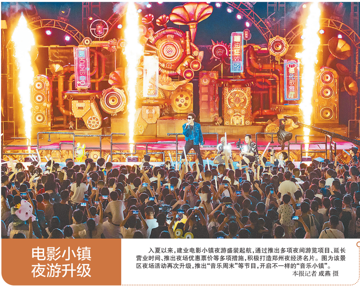
电影小镇夜游升级

据新华社北京8月16日电(记者赵文君)市场监管总局近日印发《关于新时代加强知识产权执法的意见》,针对当前侵权假冒违法行为的新特点,明确了今后一段时期知识产权执法的主要目标、重点任务和保障措施。《意见》提出,加强外商投资领域和老字号品牌的知识产权保护,集中解决企业反映比较集中的问题,加大对假冒仿冒相关公众所熟知的商标、恶意抢注商标等违法行为的打击力度,依法平等保护内外资企业的知识产权。《意见》要求,加强互联网领域知识产权执法,严厉查处网络销售、直播带货中侵权假冒违法行为,督促电子商务平台经营者、平台内经营者落实“通知、删除、公示”责任。《意见》突出执法重点,在加强重点产品执法方面,以关系人民群众生命健康、财产安全的食品药品、农资、电子产品、家用电器、汽车配件和侵权假冒多发的服饰箱包等日用消费品为重点,严厉查处商标侵权、假冒专利等违法行为。聚焦初级农产品、加工食品、道地药材、手工艺品等,加大对地理标志侵权假冒违法行为的查处力度。《意见》还提出,健全完善执法机制,支持有条件的地方开展试点,建立完善执法部门与平台经营者、权利人的沟通合作机制,依托电商平台大数据资源、快递物流等信息和跨部门衔接、跨区域协作机制,打通生产、流通、销售等环节,强化全链条执法、源头打击。今年以来,各级市场监管部门以保障民生为导向,聚焦群众反映强烈、社会关注的突出问题,查办了一批与群众利益息息相关的违法案件,保护了品牌企业的合法权益。