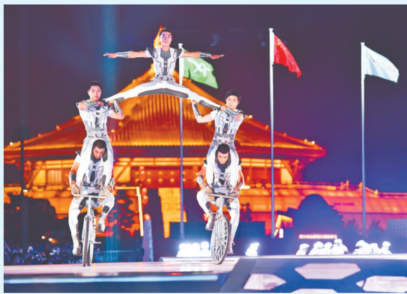
开幕式上的文艺表演