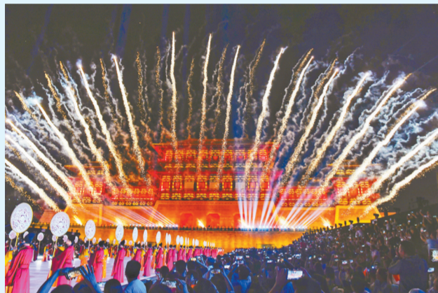
开幕式现场

河南运之杰足球俱乐部与郑州大学体育学院的强强合作,为足球幼苗搭建了锻炼平台,给学生提供了施展才华的宝贵机会,对人才培养人才,进一步明确办学方向具有深远意义。