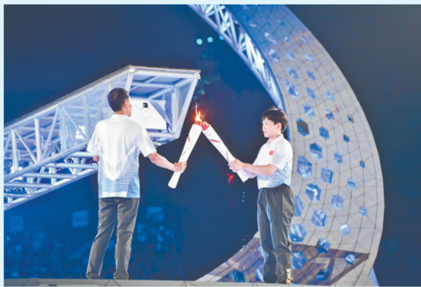
点火环节