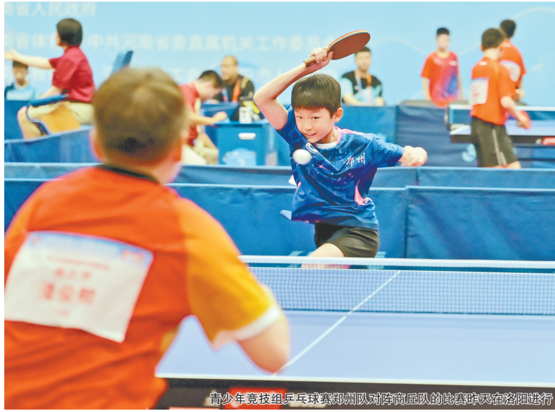
青少年竞技组乒乓球赛郑州市队对阵商丘队的比赛昨天在洛阳进行

省十四运会共设青少年竞技组、学生组和社会组三个组别。青少年竞技组设24个大项633个小项,截至8月17日,已经完成16个大项的比赛,共产生478枚金牌。学生组分大学生、中学生两个组别,大学生组设17个大项、中学生组设15个大项,截至8月17日,已完成大学生14个大项和中学生14个大项的比赛。社会组设置32个大项,其中省辖市组设置19个大项127个小项,省直和中央驻豫单位组设置13个大项30个小项,截至8月17日,已完成省辖市组15个大项、