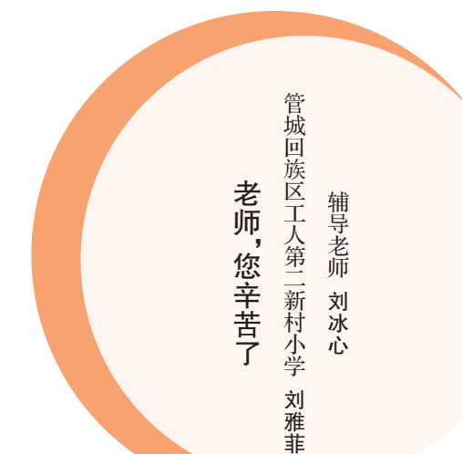
管城回族区工人第二新村小学 刘雅菲 辅导老师 刘冰心