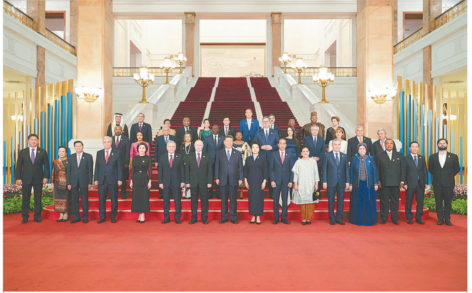
10月17日晚,国家主席习近平和夫人彭丽媛在北京人民大会堂举行宴会,欢迎来华出席第三届“一带一路”国际合作高峰论坛的国际贵宾。这是习近平和彭丽媛同国际贵宾合影留念。

新华社北京10月17日电(记者 杨依军 孔祥鑫)10月17日晚,国家主席习近平和夫人彭丽媛在人民大会堂举行宴会,欢迎来华出席第三届“一带一路”国际合作高峰论坛的国际贵宾。李强、赵乐际、王沪宁、蔡奇、丁薛祥、李希、韩正出席。