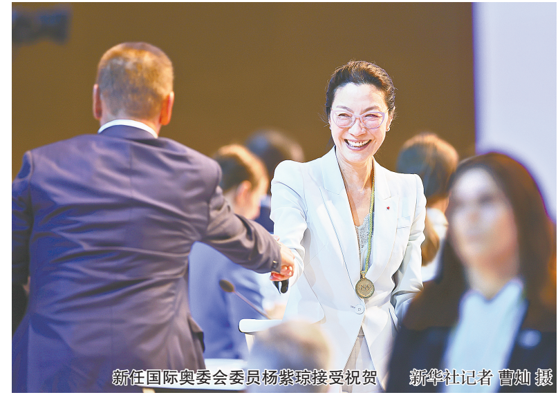
新任国际奥委会委员杨紫琼接受祝贺