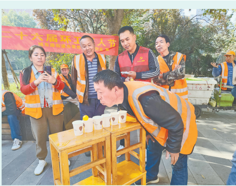
昨日,管城区城东路街道办事处城之嘉物业举办第二十六届环卫工人节庆祝活动。活动分为趣味运动会和义剪环节。趣味运动会设置了跳绳、吹乒乓球、夹玻璃珠、拔河等多个比赛项目。

平台搭建常态化,牵线搭桥不停歇。下一步,中牟县将持续开展“金秋招聘月”系列活动,线上招聘会也将同步进行,真正做到线上线下相结合,招聘活动不停歇,助推全县经济稳步回升奋力实现经济“全年红”。