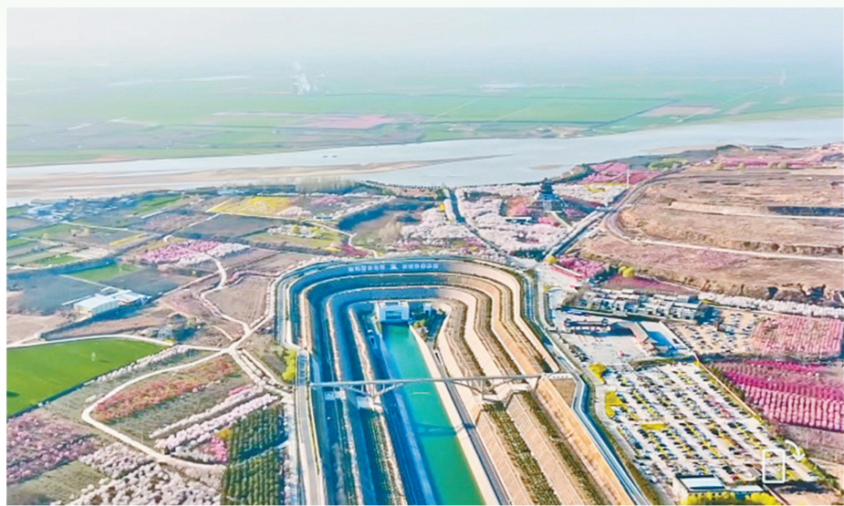
走进春天里的穿黄工程(资料图片)

空山新雨后的秋日清晨,走进郑州市王村镇,天边的阳光轻轻拨开云雾,一排排农家小院干净整洁,一条条乡间道路平坦宽阔,一幅幅村净、景美、业旺、民富的美丽乡村新画卷徐徐展开。