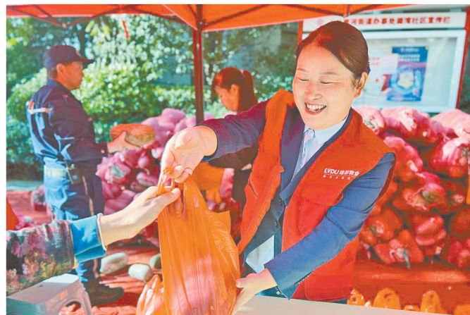
近日,管城区十八里河街道湾湾社区开展“‘益’路同行,感恩有你”公益助农活动。赠送冬瓜近两万个,帮助菜农解决了实际困难,助力幸福和谐社区建设。

近年来,姚家镇派出所一直坚持将矛盾纠纷的多元解决放在首位,构建了多方联动的调解工作格局,践行“枫桥经验”,并进一步加强信访、司法、派出所等相关部门的沟通联系,以推进矛盾纠纷源头化解,不断提升群众的获得感、幸福感和安全感。