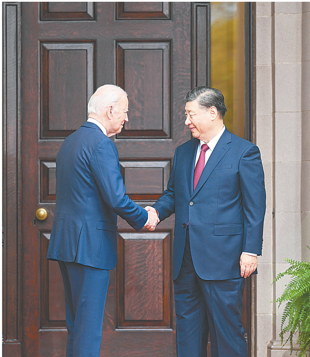
当地时间11月15日，国家主席习近平在美国旧金山斐洛里庄园同美国总统拜登举行中美元首会晤。

新华社旧金山11月15日电(记者倪四义 颜亮 吴晓凌)当地时间11月15日，国家主席习近平在美国旧金山斐洛里庄园同美国总统拜登举行中美元首会晤。两国元首就事关中美关系的战略性、全局性、方向性问题以及事关世界和平和发展的重大问题坦诚深入地交换了意见。