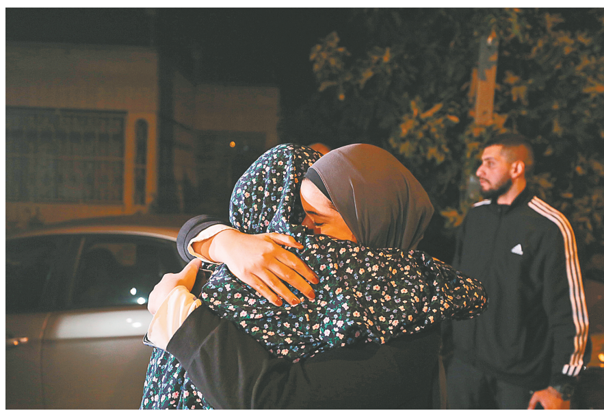
11月24日，一名被关押的巴勒斯坦人（左）获释后回到耶路撒冷。

程处自停火以来已接收137辆卡车救援物资，这是巴以新一轮冲突爆发以来加沙地带接收的最大一批救援物资。