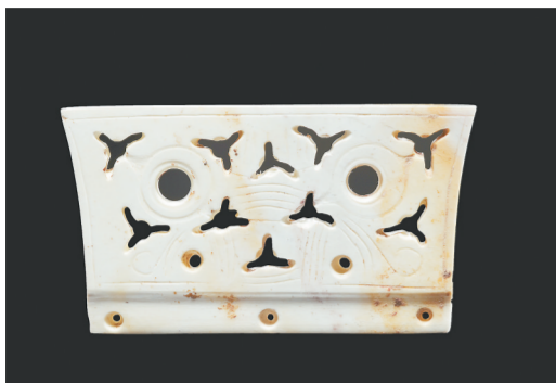
浙江杭州良渚遗址出土的冠状器

新华社北京11月29日电(记者徐壮施雨)国家文物局29日举行“考古中国”重大项目重要进展工作会,通报了浙江杭州良渚古城及水利系统遗址、江苏常州寺墩遗址、湖北沙洋城河遗址、南岛语族起源与扩散研究4项考古新进展。