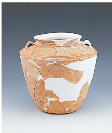
福建平潭岛龟山遗址出土的陶器