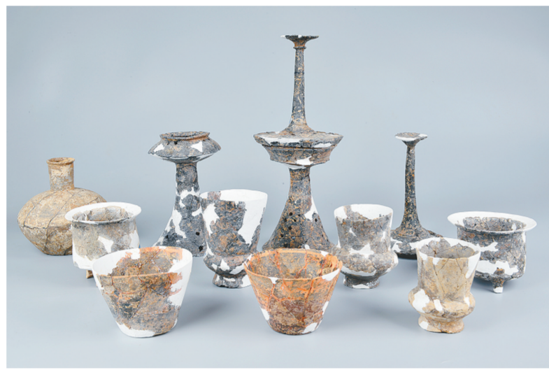
湖北沙洋城河遗址出土的部分陶器组合