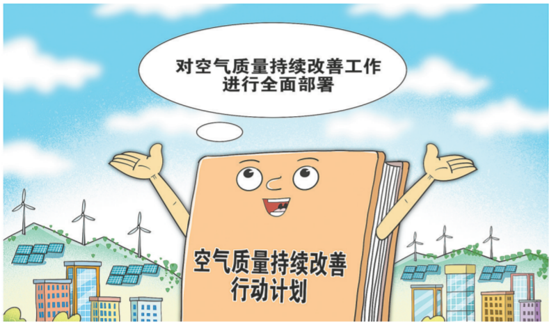
新华社发朱慧卿作

下降10%,重度及以上污染天数比率控制在1%以内;氮氧化物和VOCs排放总量比2020年分别下降10%以上。京津冀及周边地区、汾渭平原PM 2.5 浓度分别下降20%、15%,长三角地区PM 2.5 浓度总体达标,北京市控制在32微克/立方米以内。