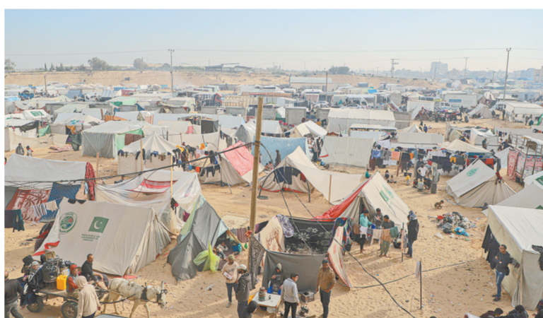
这是12月8日在加沙地带南部城市拉法拍摄的临时营地。联合国相关数据显示,本轮巴以冲突爆发以来,加沙地带已有超过180万人流离失所。