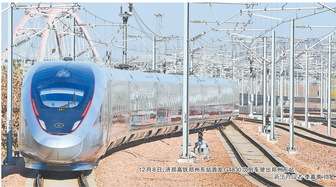
12月8日,济郑高铁郑州东站首发G4830次列车驶出郑州东站

十多年来,随着郑西、郑徐、郑渝、郑阜、郑太、济郑高铁等相继建成通车,以郑州为中心的“米”字形高铁网越来越便捷通达。从“纸上蓝图”变成“脚下通途”,“米”字形高铁网在推动中原更加出彩的征程中绽放出熠熠华彩。