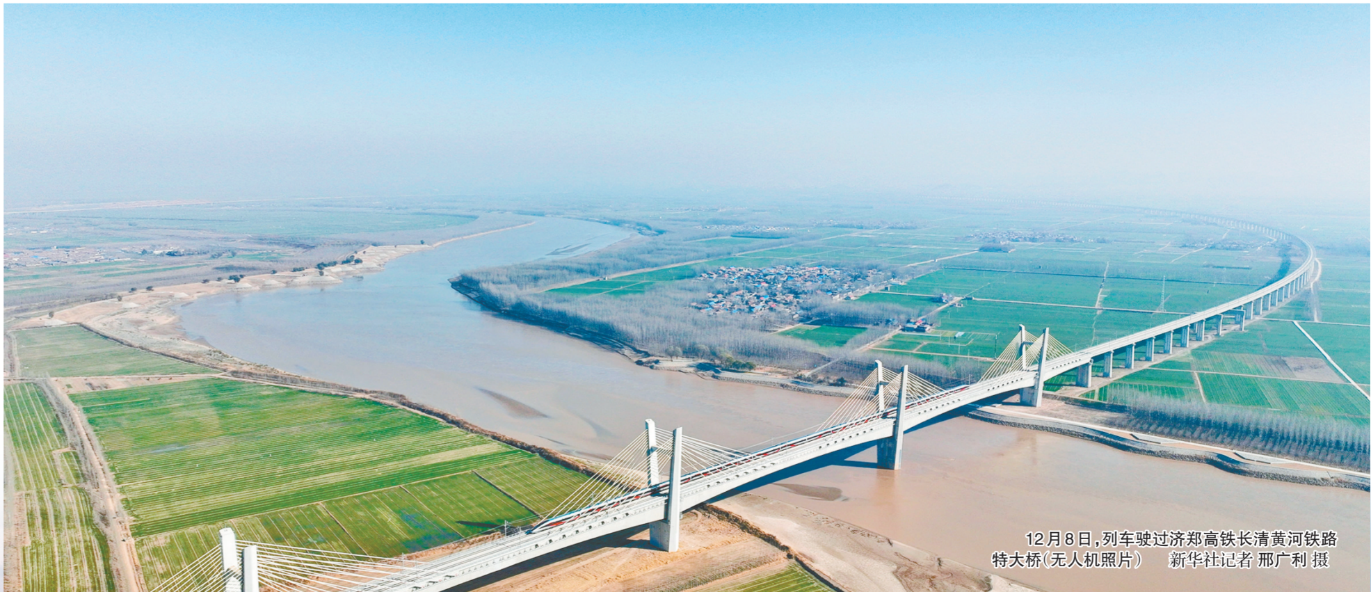
12月8日,列车驶过济郑高铁长清黄河铁路特大桥(无人机照片)

长路当歌,大道如虹。一条条宽广畅通的高铁轨道,一张张四通八达、纵横交错的立体交通网,让郑州快速融入世界经济循环体系,也让最美的风景永远在路上。