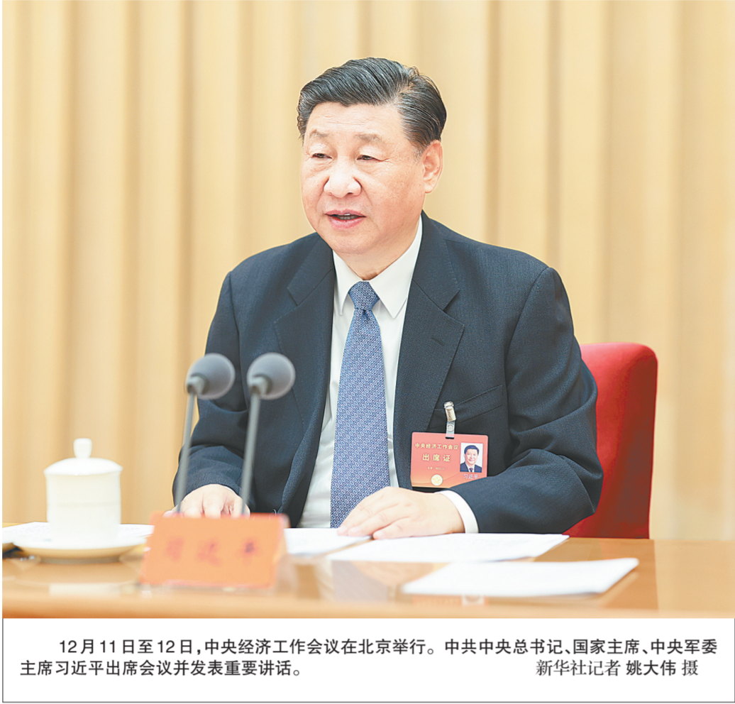
12月11日至12日，中央经济工作会议在北京举行。中共中央总书记、国家主席、中央军委主席习近平出席会议并发表重要讲话。

新华社北京12月12日电 中央经济工作会议12月11日至12日在北京举行。中共中央总书记、国家主席、中央军委主席习近平出席会议并发表重要讲话。中共中央政治局常委李强、赵乐际、王沪宁、蔡奇、丁薛祥、李希出席会议。