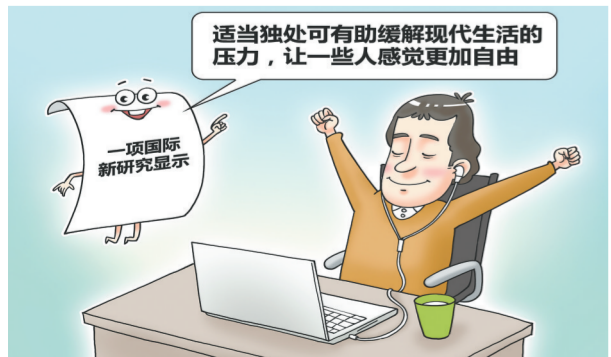
经常独处者“容易孤独”的说法,在某种程度上可能是误解。一项国际新研究显示,适当独处可有助缓解现代生活的压力,让一些人感觉更加自由。研究人员说,这项研究表明独处可以是一个健康、积极的选择。新华社发 王威作

《指导意见》明确了提升高水平视听系统供给能力,打造现代视听电子产业体系,开展视听内循环畅通行动、提升产业国际化发展水平等重点任务。