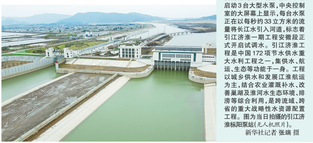
12月16日,坐落在安徽省南部的引江济淮枞阳泵站启动3台大型水泵,中央控制室的大屏幕上显示,每台水泵正在以每秒约33立方米的流量将长江水引入河道,标志着引江济淮一期工程安徽段正式开启试调水。引江济淮工程是中国172项节水供水重大水利工程之一,集供水、航运、生态等功能于一身。工程以城乡供水和发展江淮航运为主,结合农业灌溉补水、改善巢湖及淮河水生态环境、排涝等综合利用,是跨流域、跨省的战略性水资源配置工程。图为当日拍摄的引江济淮枞阳泵站(无人航照片)。