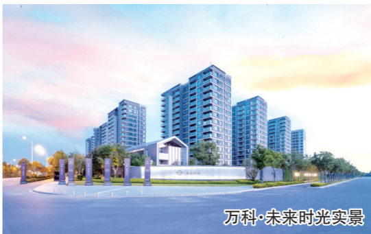
万科·未来时光实景

在万科·未来时光，建筑面积约1400平方米的下沉式会所早在项目交付前便已建成使用。在会所内记者看到，恒温游泳池、健身房、瑜伽室、儿童乐园、棋牌室、茶室等多元空间或充满活力，或温馨雅致，已有业主在此会客、阅读、临窗观景、放松休憩，丰盛而美好的生活场景正在上演。