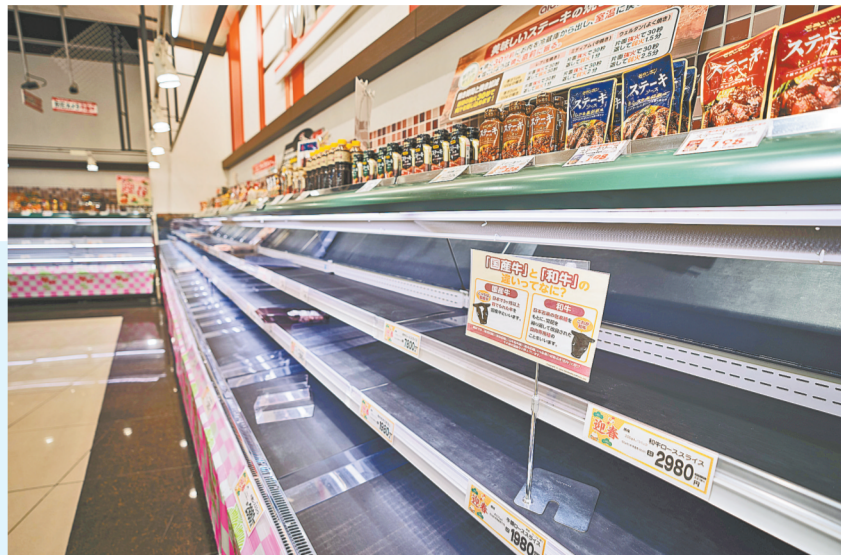
这是1月2日在日本石川县羽咋郡一家大型超市拍摄的食品货架。超市部分物资发生短缺。

新华社东京1月2日电(记者 姜俏梅 钱铮)据日本媒体2日报道,能登半岛7.6级地震造成的死亡人数已升至55人。新华社记者2日从中国驻名古屋总领事馆和驻新潟总领事馆处获悉,目前暂未收到辖区内侨胞受灾或伤亡情况报告。