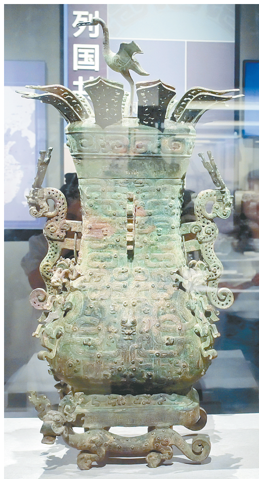
藏于河南博物院的莲鹤方壶

2000多年前的春秋时期，素以诗乐浪漫闻名天下的郑国别出心裁，令工匠制作一对青铜方壶，将10组双层莲瓣置于青铜之上，并立一张翅之鹤，引颈欲鸣，好似在说乱世亦能有赏花审美的风雅、遨游天际的自由。