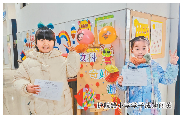
护航路小学学子成功闯关