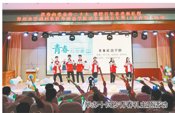
举办十四岁青春礼主题活动