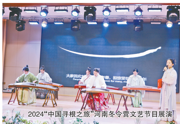
2024“中国寻根之旅”河南冬令营文艺节目展演

“新时代基础教育高质量发展,需要营建‘去功利、致良知’的教育生态,打造‘有人性、有温度、有故事、有美感’的新样态学校,坚守‘全面育人、文化内生、课程再造、整体建构’的教育主张,凝练‘生命真善美’的教育思想,追寻‘求真、从善、臻美’的教育愿景。”