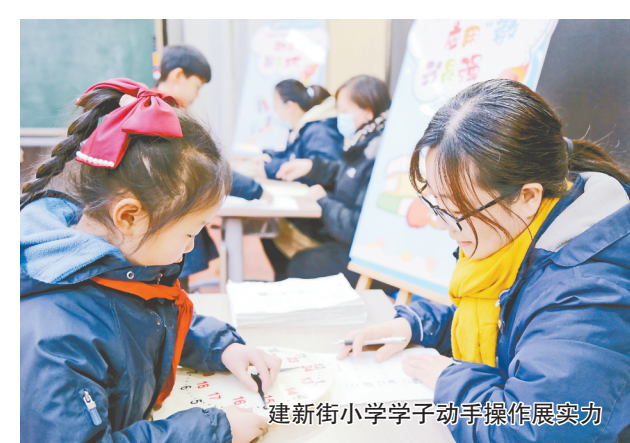
建新街小学学子动手操作展实力