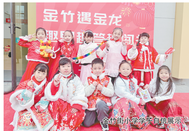
金竹街小学学子自信展示

“年味儿小铺”引导学生运用数学中的分类思维将选到的年货按照衣、食、住、行四个维度进行分类;“转福到我家”摊位将语文和数学进行完美融合;民俗游戏摊位让孩子直观体验从具体形象到抽象思维的过渡;归纳整理迎新项目,将多学科能力相融合,对学生的综合素养进行了评价……郑州实验外国语学校东校区一年级自组织评价以龙年为主线,创设“龙娃迎春”“庙”趣横生”的大情境,以展现学生的综合运用能力,用传统文化浸润孩子的心田。孩子们在具体情境中提升了解决问题的能力和综合素养,在项目式闯关中提高学习兴趣,增强了自信、收获了成功,在自信与快乐中“学有所思、学有所长、学有所用”。