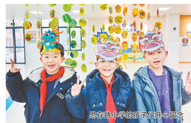
思存路小学的孩子开心留念