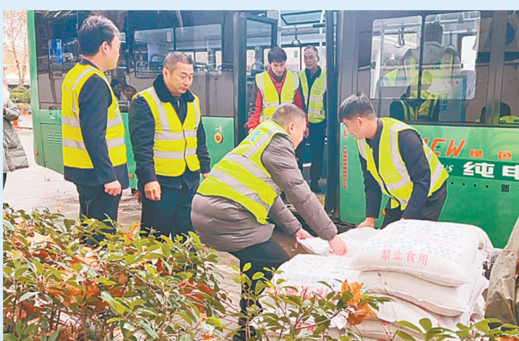
应对雨雪冰冻天气,公交人迅速行动

本报讯(记者 张倩 文图)1月31日,为做好本轮雨雪冰冻天气应对工作,郑州公交人迅速行动,各岗位人员迅速进入待命状态,完善应急储备工作,强化车辆安全检查,加密高峰运力配置,以安全、便捷、温暖的公交服务,保障市民乘客出行需求。