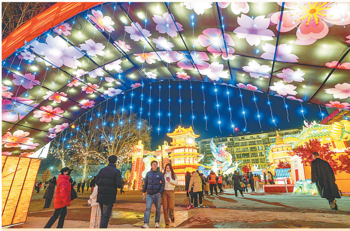
“中原奇妙游”郑州龙年迎春灯会将中原文化与彩灯艺术巧妙结合,让市民陶醉在浓郁的节日氛围中

一路春意盎然,一派欣欣向荣,一片欢声笑语。随处可见的喜庆笑颜,比比皆是的张灯结彩……甲辰龙年在人声鼎沸中欢乐开启。