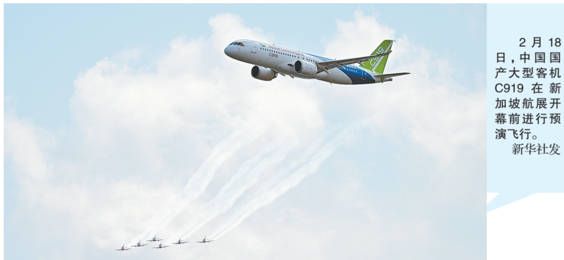
2月18日，中国国产大型客机C919在新加坡航展开幕前进行预演飞行。

研究人员对美国圣迭戈动物园的9只倭黑猩猩、4只红毛猩猩、4只大猩猩以及在德国莱比锡动物园的17只黑猩猩的视频资料展开研究。