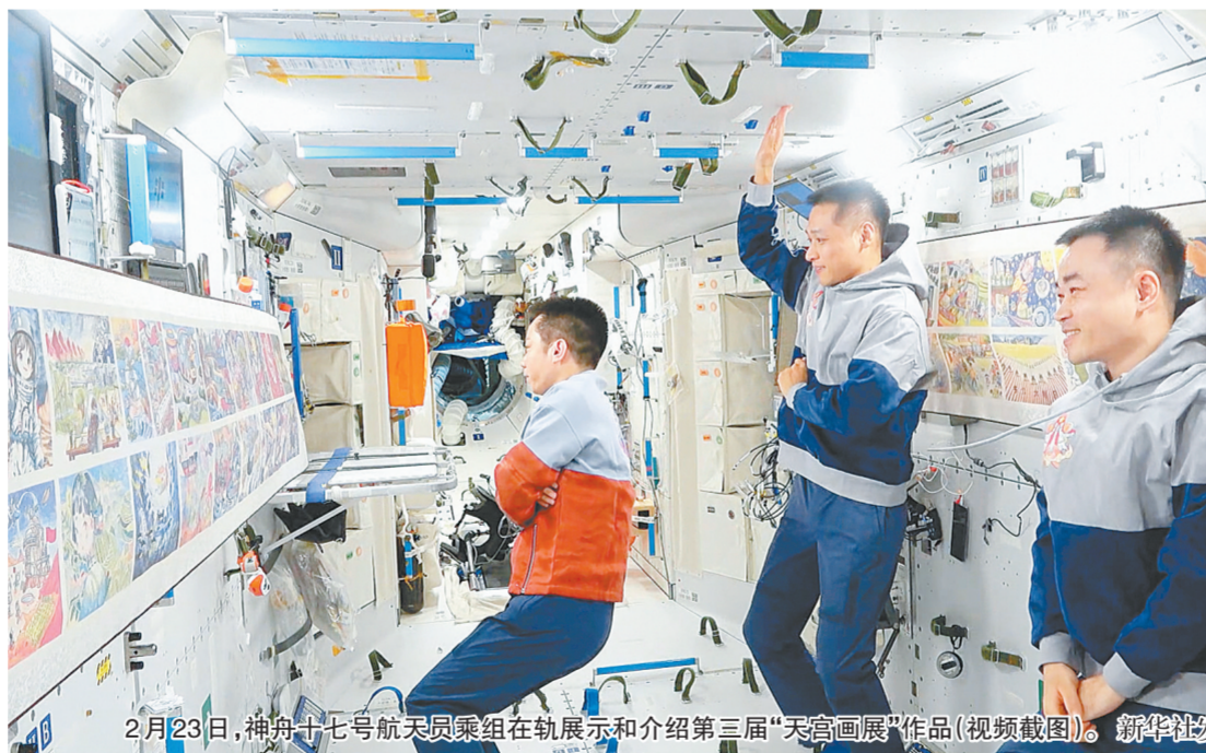
2月23日，神舟十七号航天员乘组在轨展示和介绍第三届“天宫画展”作品（视频截图）。

新华社北京2月23日电（邓孟 郭明芝）2月23日，第三届“天宫画展”在中国空间站开展。正在太空出差的神舟十七号航天员乘组在轨展示和介绍了新时代青少年畅想中国式现代化的美丽画卷。 本届画展自2023年10月正