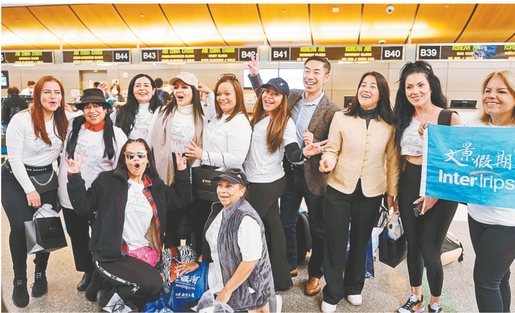
2月25日,旅游团成员在美国洛杉矶国际机场留影。

新华社洛杉矶2月27日电(记者 黄恒)“灿烂中国游”首支赴美旅游团日前从美国洛杉矶启程,在为期10天的行程中将前往北京、苏州、无锡、杭州和上海等中国城市。