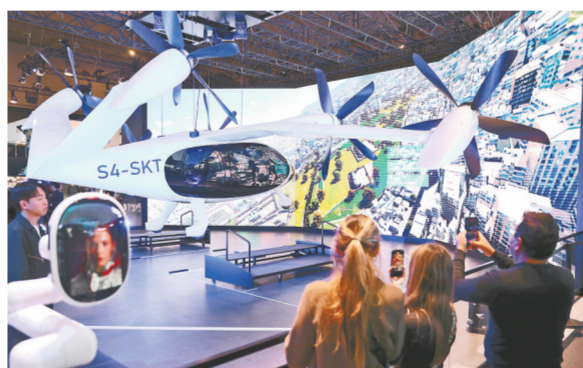
▲这是2月27日在西班牙巴塞罗那举行的世界移动通信大会上拍摄的都市空中交通工具展品。

为期4天的2024年世界移动通信大会26日在西班牙巴塞罗那会展中心拉开帷幕。今年大会主题是“未来先行”,重点关注超越5G、智联万物、AI人性化、数智制造、颠覆规则、数字基因6大领域。