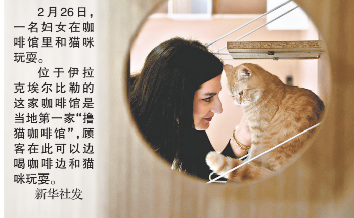
2月26日,一名妇女在咖啡馆里和猫咪玩耍。位于伊拉克埃尔比勒的这家咖啡馆是当地第一家“撸猫咖啡馆”,顾客在此可以边喝咖啡边和猫咪玩耍。