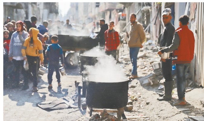
2月27日,在加沙地带北部的杰巴利耶难民营,人们等待领取食物。

联合国机构官员27日警告,巴勒斯坦加沙地带目前至少四分之一人口濒临饥荒,若不及时采取相应行动,大范围饥荒“几乎不可避免”。