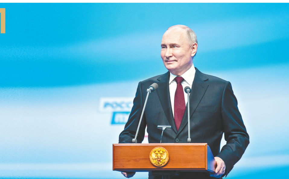
3月18日，普京在俄罗斯首都莫斯科的竞选总部回答记者提问。

分析人士认为，普京连任后，俄内政外交将继续既有政策，包括着力加强技术自主，促进经济多元，积极发展与亚洲、非洲、中东和拉美等地区友好国家的关系，推动世界多极化发展。