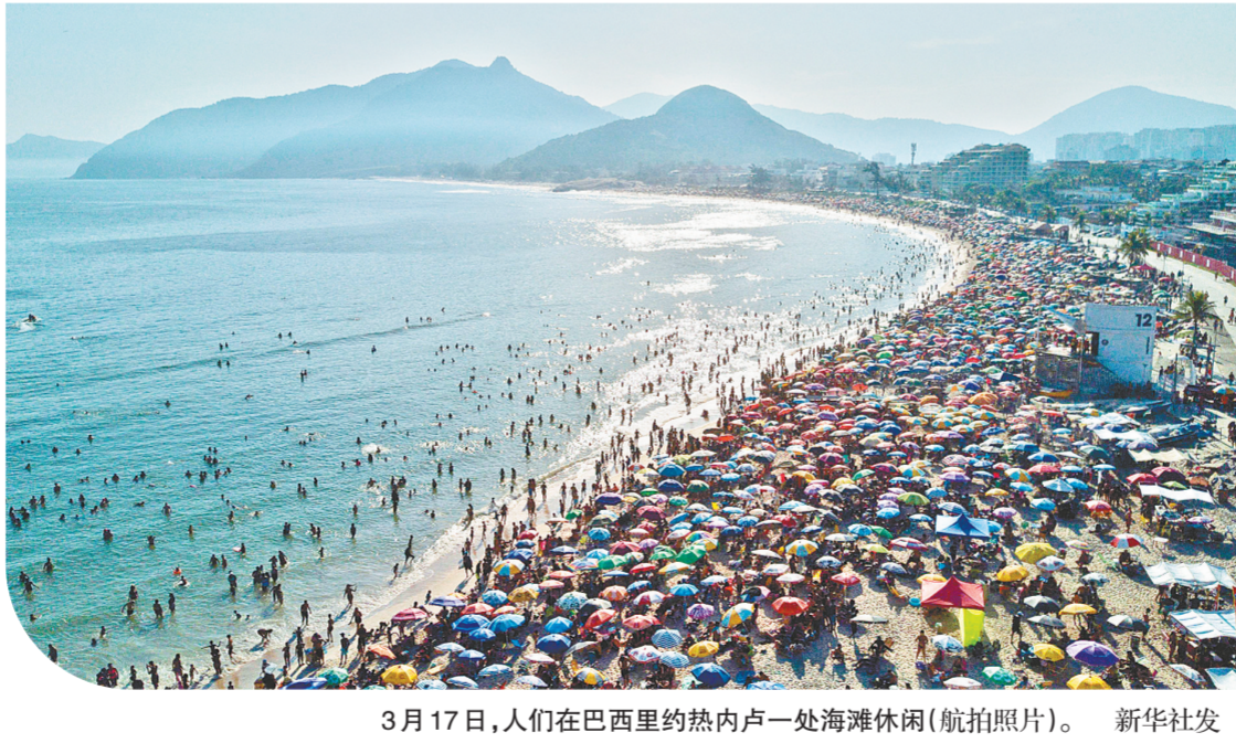
3月17日，人们在巴西里约热内卢一处海滩休闲(航拍照片)。