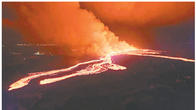
这是3月16日在冰岛西南部雷克雅内斯半岛格林达维克镇附近拍摄的火山喷发的场景。

冰岛西南部雷克雅内斯半岛格林达维克镇附近一座火山3月16日再次喷发。这是该火山自去年底以来第四次喷发。冰岛气象局说，从流出的熔岩量看，第四次喷发的规模最大。