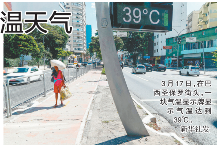
3月17日，在巴西圣保罗街头，一块气温显示屏显示气温达到39°C。