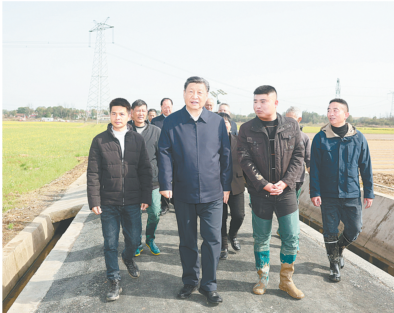
3月18日至21日,中共中央总书记、国家主席、中央军委主席习近平在湖南考察。这是19日下午,习近平在常德市鼎城区谢家铺镇港中坪村,同种粮大户、农技人员、基层干部亲切交流。

随后,习近平来到巴斯夫杉杉电池材料有限公司考察。这是一家主营锂离子电池正极材料研发、生产和销售的中德合资企业。习近平听取当地加快发展新质生产力、扩大高水平对外开放等情况介绍,察看企业产品展示,了解材料性能测试情况和电池生产流程。他强调,科技创新、高质量发展是企业不断成长壮大、立于不败之地的关键所在,民营企业、合资企业在这方面都可以大有作为。中国开放的大门会越开越大,我们愿意同世界各国加强交流合作,欢迎更多外国企业来华投资发展。