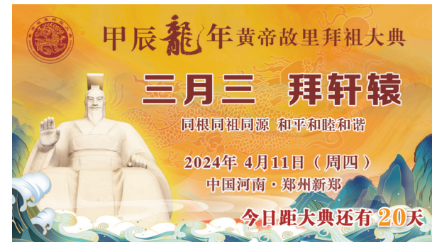
甲辰龍年黃帝故里拜祖大典 三月三 拜軒轅 同根同祖同源 和平和睦和諧 2024年4月11日(周四) 中国河南·鄭州新鄭 今日距大典還有20天