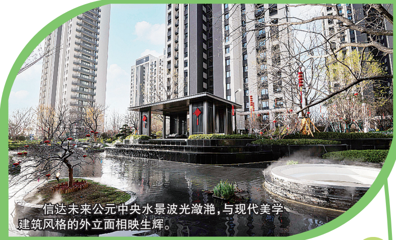
信达未来公元中央水景波光潋滟，与现代美学建筑风格的外立面相映生辉。

眼见为实，实景明证。交付仪式后，记者实地感受信达未来公元二号院的交付高品质。首先映入眼帘的是小区的“颜值担当”大门，未来公元二号院的大门与园区的楼栋外立面颜色相映生辉，两侧运用金属格栅设计，硬朗线条现代感十足，整体效果恢宏大气，营造归家礼仪。