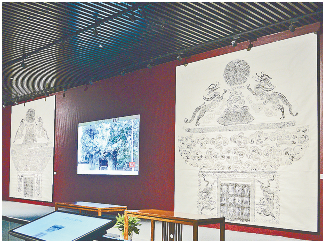
唐代·大唐碑(碑首)拓片