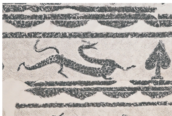
东汉·启母阙上的龙纹拓片