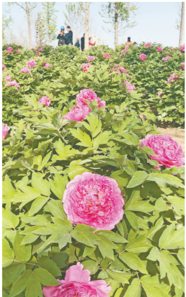
本报讯(记者 裴其娟 通讯员 陈晓蕾 文/图)最美人间四月天，牡丹扮靓植物园。8日上午，明媚春光中，姹紫嫣红的牡丹在郑州植

物园争奇斗艳(如图)，游客流连忘返，感受国色天香的“花王”风采。由郑州市园林局主办的郑州市第十四届牡丹芍药花展在这里开幕，花展主题为“品国色天香 赏花都锦绣”，将持续至5月7日。