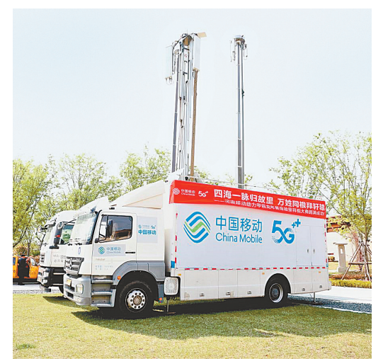
会场前置的无线通信应急车

本报讯(记者 李莉 通讯员 陈春晓 文图)“三月三，拜轩辕”，肇始春秋，绵延至今。4月11日，以“同根同祖同源，和平和睦和谐”为主题的甲辰年黄帝故里拜祖大典在黄帝故里隆重举行。海内外华夏儿女循着祖先的足迹，会聚河南新郑，共拜轩辕黄帝。