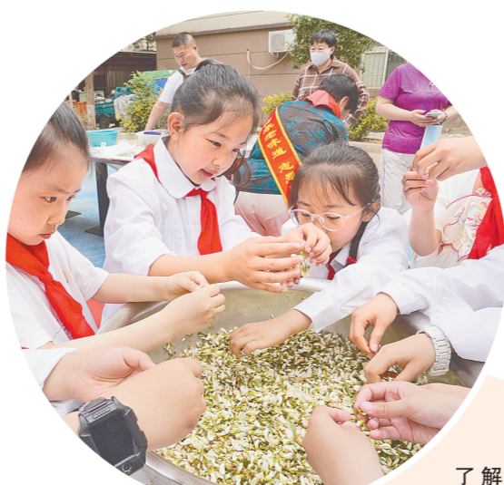
了解槐花，从择槐花开始

活动期间，社区还举行了“致敬模范”仪式，给社区的老模范、老党员戴上红花，喜迎五一劳动节，孩子们为老人表演文艺节目的同时，也接受了一次尊老、敬老的传统文化教育。