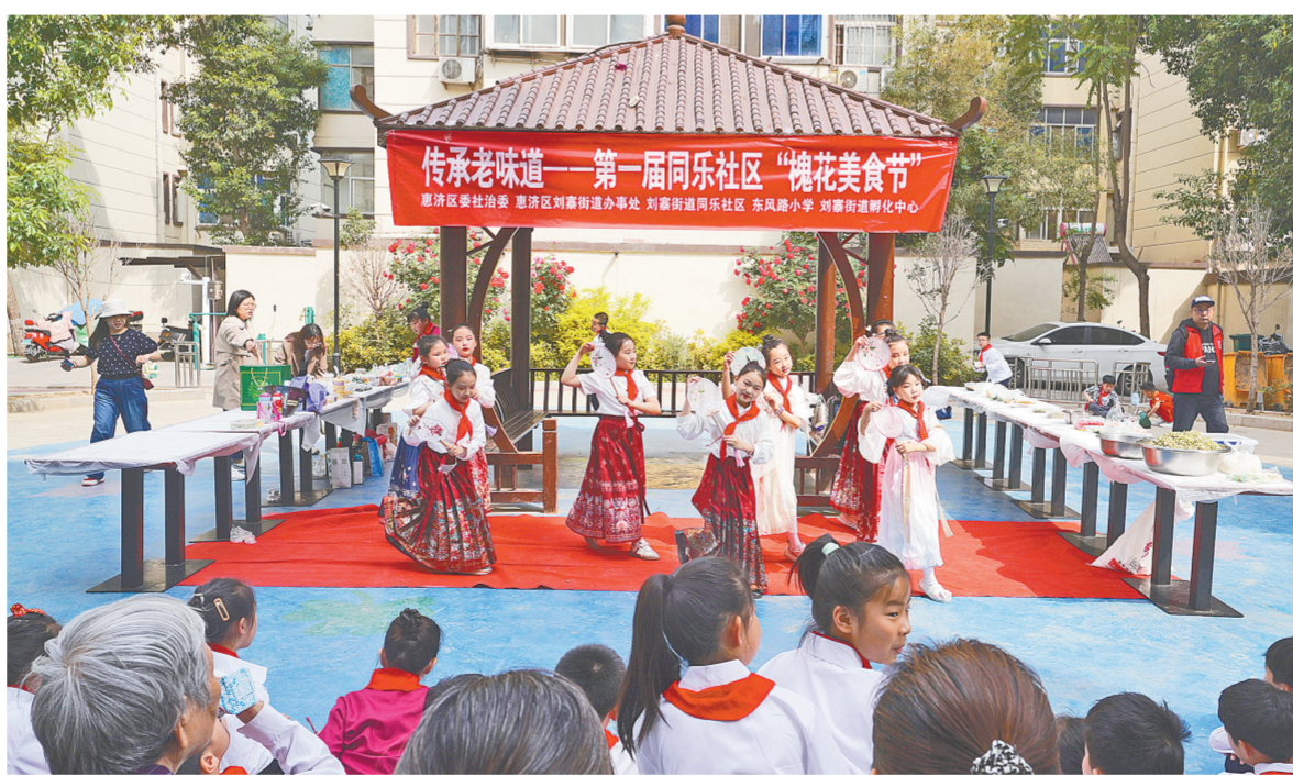
孩子们为老人表演文艺节目

本报讯(记者 马健 文/图)4月22日上午，惠济区同乐社区第一届“槐花美食节”举行，近百名小朋友和老人齐聚刘寨街道同乐社区，以“致敬模范”“传承老味道”“槐花百家宴——做槐花蒸菜、包槐花饺子”的方式度过了一个愉快的上午。