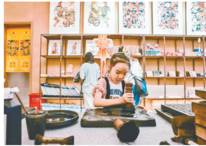
只有河南·戏剧幻城非遗店

《老虎和泥泥狗》《纸上河南》《非遗里的河南》三家主题非遗店。通过对黄河文明、在地文化与非遗文化的挖掘，厚重的河南文化被转化成文旅体验，木版年画、皮影戏等新颖的文化体验产品与消费亮点，将带给游客观剧外的多种玩法。 据悉，为给游客一个温馨、安全、顺畅的五一出游环境，建业电影小镇和只有河南·戏剧幻城两个景区不仅为游客提供免费行李寄存、免费轮椅和婴儿车等暖心服务，在五一假期期间，两景区也将延长营业时间，并增加节目两个。目前，适合不同群体出游的特惠票种已开启预售，相关预约通道也已提前开放，计划假期出行的游客可提前通过官方平台购票预约。