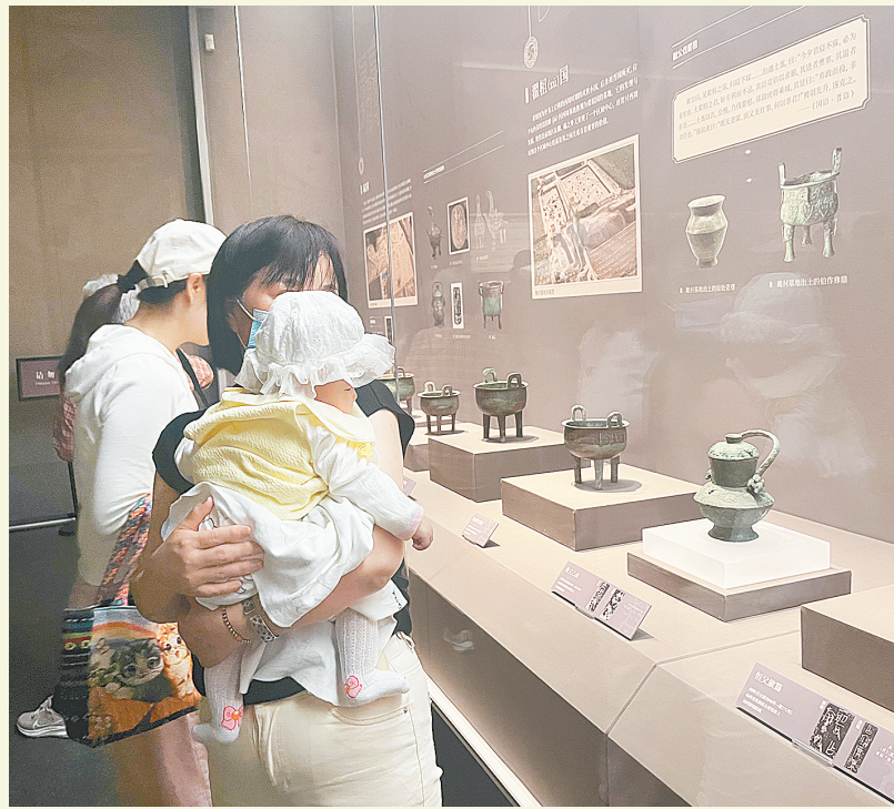
市民在参观精品文物展

本报讯(记者 左丽慧 文/图)昨日,由山西博物院、河南博物院共同主办,郑州博物馆承办的“晋国雄风——山西两周精品文物展”在郑州博物馆火热开幕。本次展览精选山西博物院珍藏的两周时期文物157件(套),其中珍贵的一、二级文物60余件(套),引领观众穿越历史长河,重温曾雄霸一方的诸侯大国——晋国的壮丽篇章。