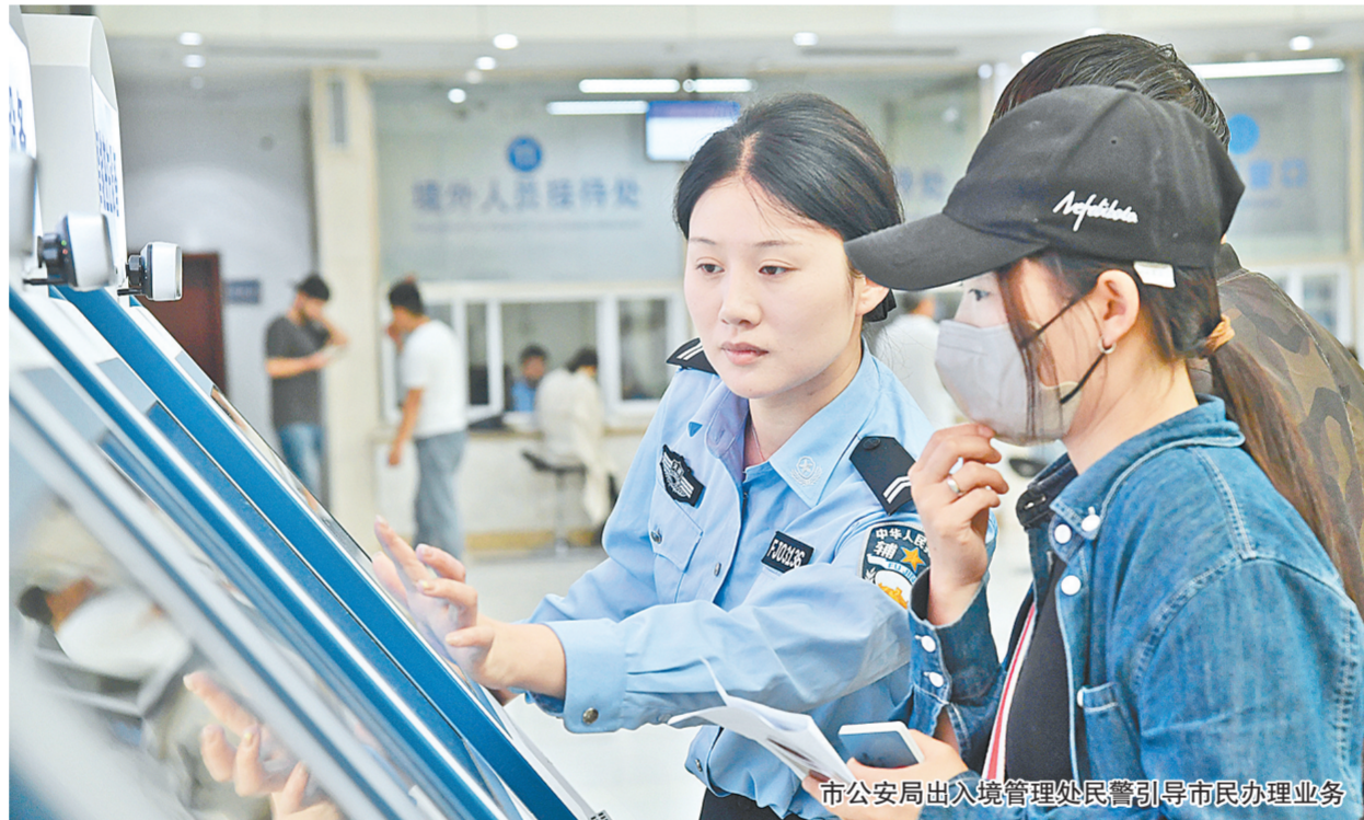
市公安局出入境管理处民警引导市民办理业务

本报讯(记者 张玉东 文周雨图)5月7日,记者从郑州市公安局出入境管理处获悉,国家移民管理局决定自2024年5月6日起实施若干便民利企出入境管理政策措施,其中,郑州被列入20个试点实行换发补发出入境证件“全程网办”的城市之一。