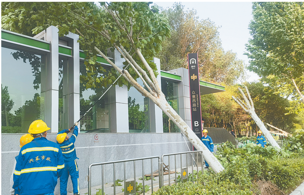
市政人员迅速行动,开展抢险应急处置

本报讯(记者 谷长乐 文/图)5月14日晚,郑州市出现大风强对流天气,全市各级城管部门迅速行动,开展抢险应急处置,恢复城市市容市貌。