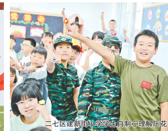
二七区建新街小学学生自制心理解压花