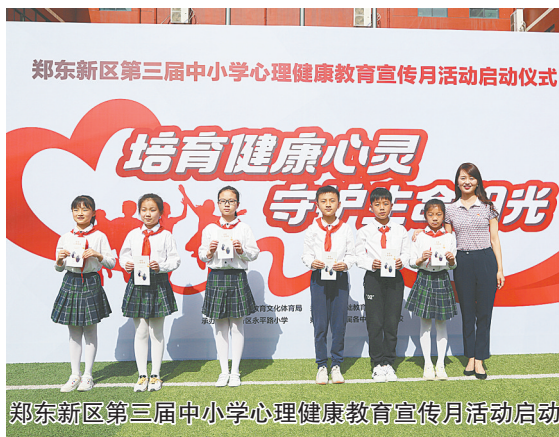
郑东新区第三届中小学心理健康教育宣传月活动启动仪式

根据学生年龄、身心特点,管城回族区教育局研讨开发了心理游戏体验课,开展了管城回族区“健康杯”心理小游戏体验活动评比。通过各种活动体验,塑造学生健康的心灵。为丰富学生校园文化生活,提高学生心理素质,