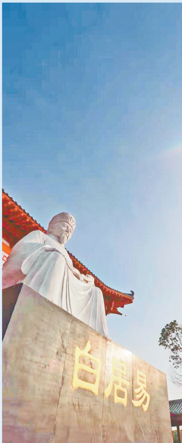
白居易雕像

“他兼具李白的浪漫与杜甫的现实,无论为人文还是为官,白居易对后世影响深远,更为千古文坛‘天花板’苏东坡所崇敬,其‘东坡’之号也缘于白居易。”郭伟民说,与白居易相比,白行简在文学上的巨大贡献,是其代表作唐传奇《李娃传》,为后代小说前身,写荣阳大族郑生与长安娼女李娃的情感故事,