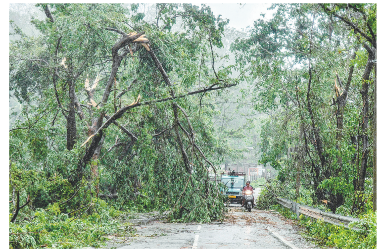
5月28日，在印度高哈蒂，人们从遭到破坏的树木旁驶过。据多家媒体报道，热带气旋“雷马尔”日前登陆孟加拉国南部和印度东部沿海地区，迄今已造成两国至少29人死亡。