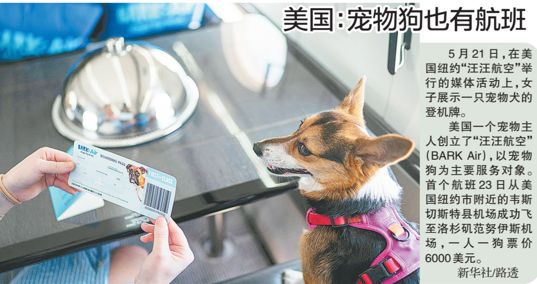
美国：宠物狗也有航班

5月21日，在美国纽约“汪汪航空”举行的媒体活动上，女子展示一只宠物狗的登机牌。