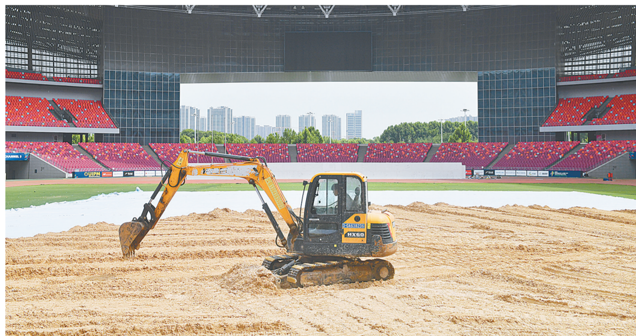
“双世锦赛”场地搭建工程量已经完成90%