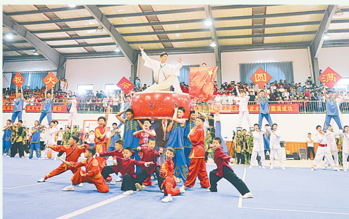
登封的一块“金字招牌”。

2023年，郑州市文旅文创产业大会明确提出打造“天地之中、华夏之源、功夫郑州”城市品牌。在此大背景下，有塔沟武校、鹅坡武校、小龙武校等20所武校加入的登封市武校联合会在当年9月底正式成立，旨在协调各方力量，更好地传承、弘扬中华武术文化，共同做大做强武术产业。“武校同宗，和谐共荣”。联合会自成立以来，很好地发挥了武校与社会各界沟通联系的桥梁作用，通过开展武校校际观摩交流、积极捐赠登封市教育发展基金等多项工作，形成了团结互助、共同提升的良好局面。