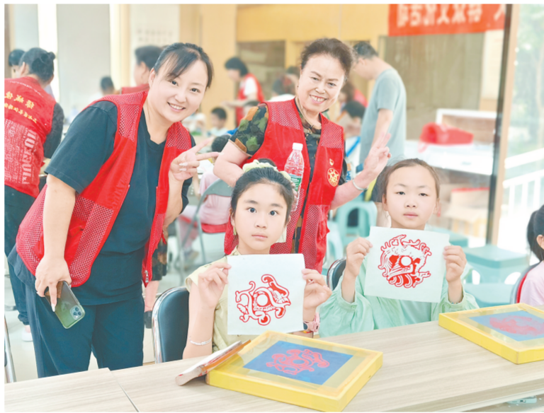
日前,二七区长江路街道玫瑰花园社区新时代文明实践站举办了“体验丝网印刷 感受非遗魅力”主题活动。让孩子们通过亲身体验的方式,不仅对传统文化产生了浓厚的兴趣,还锻炼了自身的动手操作能力。

此外,被认定为郑州市质量标杆的企业,将择优推荐申报河南省质量标杆。同时,郑州支持获评市质量标杆企业加快发展,积极帮扶标杆企业开展质量品牌建设,宣传推广质量标杆典型经验。