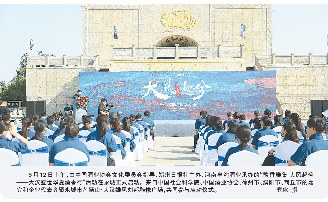
6月12日上午,由中国酒业协会文化委员会指导、郑州日报社主办、河南皇沟酒业承办的“馥香雅集 大风起兮——大汉盛世华夏酒香行”活动在永城正式启动。来自中国社会科学院、中国酒业协会、徐州市、濮阳市、商丘市的嘉宾和企业代表齐聚永城市芒砀山·大汉雄风刘邦雕像广场,共同参与启动仪式。

今年端午小长假,国铁集团郑州局管内各大小车站探亲流、旅游流、学生流等客流高度叠加,客流呈现首尾高度集中,中间短途客流需求旺盛的特点。国铁集团郑州局充分发挥“米”字形高铁网优势,科学调配运力资源,日均开行旅客列车1200余列,客流高峰日开行旅客列车1225列,根据车票预售情况,灵活调整每日运力安排,采取加开临客、动车组重联、普速列车加挂车厢等方式,提升重点地区、热门方向、旅游城市间的运输能力,累计在郑州东、洛阳龙门至南阳东、安阳东、周口东等热门区段增开临客列车272列,增开北京、上海等方向夜间高铁18列,全力满足旅客出行需求。