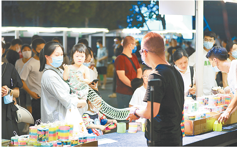
高温来袭,夜市成了市民休闲的好去处(资料图片)

河南省商业经济学会副秘书长、郑州工程技术学院副教授胡钰分析称,夏日里的消费呈现多样化、新奇化、个性化、情绪化趋势,以防晒衣为例,消费者不仅要求防晒这单一功能,更希望兼具清凉、舒适、美观和表