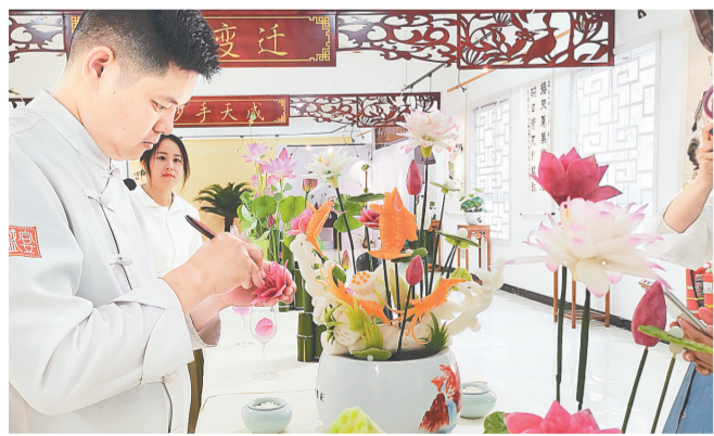
昨日,紫荆梅苑的荷花雕刻作品,为游客奉上一场荷花视觉盛宴。

记者在紫荆梅苑看到,近200平方米的展厅布置得十分雅致,墙上书画作品琳琅满目,依墙摆放着一件件盆栽荷花。最吸睛的是展厅中心展台上的几十盆以竹为花器的荷花插花作品和两盆精妙绝伦、呼之欲出的荷花雕刻作品,两种不同的造型艺术为市民游客打造一场荷花视觉盛宴。除了室内展厅,院内还养殖有多个品种睡莲,极具观赏价值,花展期间全部免费开放。