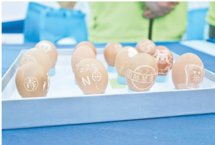
非遗文化项目与禁毒宣传元素融合,让禁毒宣传接地气

了民间传统文化的翅膀,让禁毒宣传更接地气,构成了一幅别具一格的禁毒宣传画卷,吸引了前来公园游玩的群众。