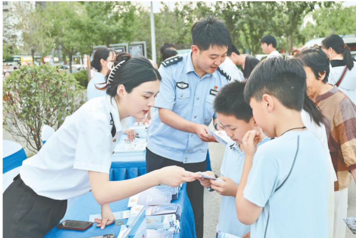
民警向市民普及禁毒知识

为了让更多人认清滥用麻精药品的危害,郑州市禁毒办、金水区禁毒办以揭开麻精药品的“谎言与真相”的形式,向群众普及禁毒知识。活动现场,禁毒民警带你逐一认识网红“减肥药”“快乐水”“聪明药”“上头电子烟”等涉(含)麻精药品的谎言,让你认清麻精药品到底是“神药”VS“毒药”,是“天使”还是“魔鬼”,教你学会防范麻精药品滥用攻略;在禁毒游戏区,禁毒大富翁、大转盘游戏带你在游戏中认识麻精药品,学习识毒防毒知识;在仿真毒品展示区,让你近距离认清麻精药品的“变形”与“伪装”;活动现场还特别设置了非遗文化展区,蛋雕“禁毒”字样、手工制作“禁毒”漆扇、“珍爱生命”剪纸、“拒绝毒品”的粮食画……将非遗文化项目与禁毒宣传元素巧妙融合,活灵活现地将禁毒知识呈现在大家面前,既为传统非遗文化赋予了新的意义,也让禁毒宣传教育插上