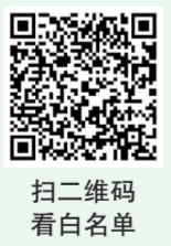
扫二维码看白名单

同时,该局工作人员提醒广大学生和家長:在选择培训机构时切记选择证照齐全的体育类校外培训机构;要与培训机构签订正规合同范本——《中小学生校外培训服务合同(示范文本)》(2021年修订版),明确培训项目、培训要求、培训退费及违约责任、争议处理等内容。切勿听信销售人员口头承诺,提防合同中出现“概不退费”等霸王条款;合理缴纳培训费用,一次性缴费时间跨度不要超过3个月或60课时,且不超过5000元。同时要主动索取正规收费发票,防止出现“卷钱跑路”等情况,确保自身权益不受损害。