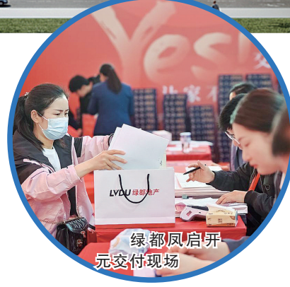
绿都凤启开元交付现场

为了与业主共建有温度的社区，绿都打造了丰富的社区文化活动，绿都业主达人秀、幸福绿都帮、绿都童军营、绿森林公益、百家宴等精彩纷呈，广受业主好评。