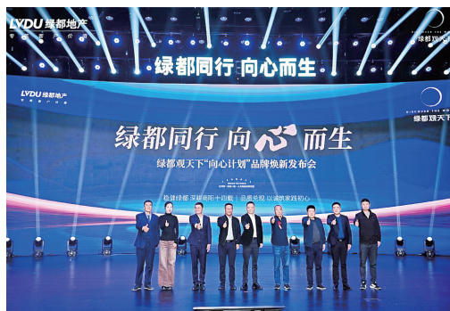
绿都观天下全面收购后的首次发布会

更为难得的是，绿都秉承房企责任担当，在房地产业面临调整期，不少房企艰难前行的时候迎难而上，收购南昌东澜府、观澜府，南阳观天下，武汉中央公园等多个合作方项目，用真金白银为业主托底，给予业主满满的安全感。