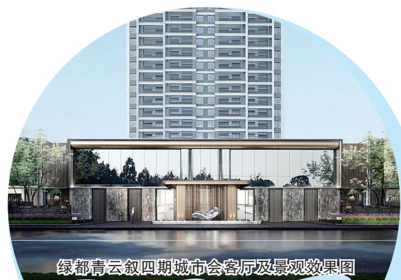
绿都云叙四期城市会客厅及景观效果图

当房地产行业迈入新周期，当品质交付成为房企的核心竞争力，当供需关系发生重大变化，有这样一家房企：稳健发展二十余年，始终将品质和交付作为企业的生命线，在市场的严峻挑战中做坚定的“产品主义者”。