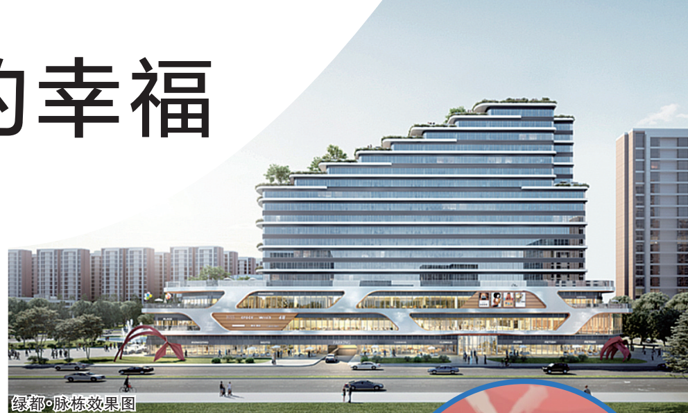
绿都云叙四期效果图

如今，有口皆碑的“绿都式服务”已然深入人心。凭借二十余年的服务经验，绿都物业建立了专业化、标准化的住宅服务体系，全方位守护业主的幸福生活，并切实履行“3121”承诺，全面覆盖业主诉求，真正做到业主有所呼，绿都有所应。