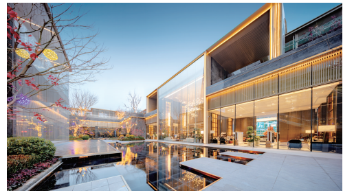
越秀·天悦江湾下沉庭院实景图