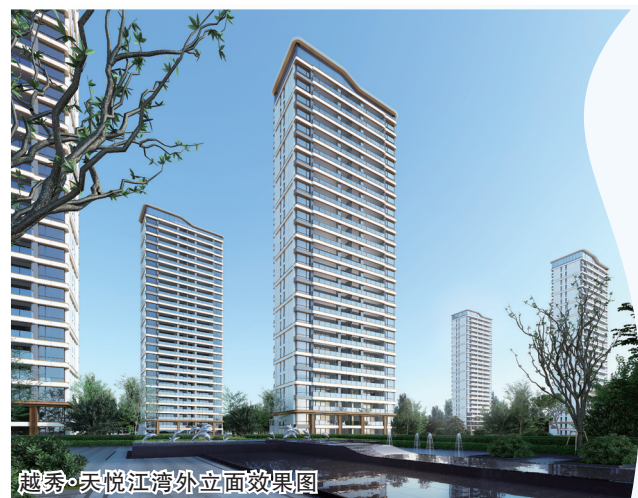
越秀·天悦江湾外立面效果图

2000多年前，古希腊哲学家亚里士多德说过：“人们来到城市，是为了生活；人们住在城市，是为了生活得更好。”