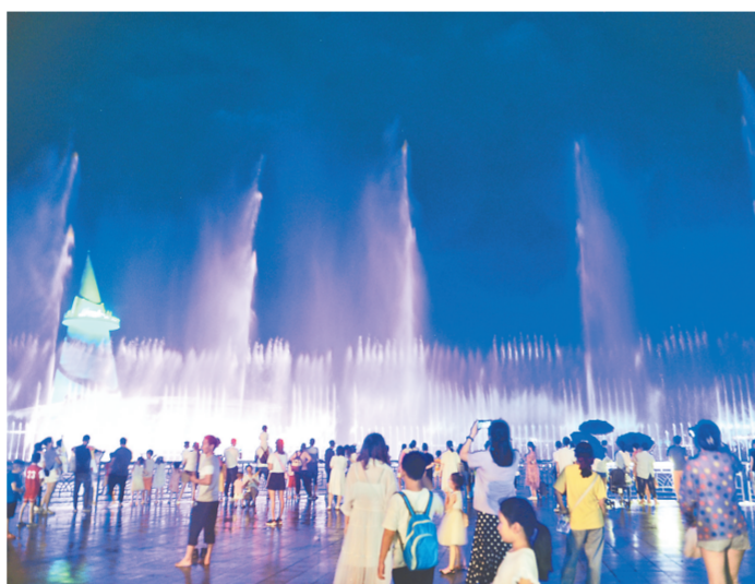
音乐喷泉,梦幻上演(资料图片)

本报讯(记者 李宇航 卢文军 通讯员 宋剑丽文/图)多彩夏日,浪漫夜游。记者从郑州绿博园获悉,郑州绿博园“绿博之夜”夜场活动将于7月6日启幕。届时,绿博园内千灯璀璨,美轮美奂,更有乐队表演、啤酒大赛、音乐喷泉等精彩纷呈的表演和趣味活动。